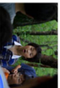
子ども同士の 関わり