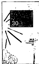
合同出版社: 2006年 価格: 1300円・税

感じの漢字 kanji no kanji 高橋 政巳 著 ページまるごとを使った作品と対になる文章、赤と黒のデザインがとても心地よい一冊。 古代文字を彫ったり、書いたりしている「築墓家」の著書が、漢字の語源から先人が残した知恵や勇気のメッセージを届けてくれます。古代の人が見ていた世界。3000年前の人達は、とても詩人でした。絵心たっぷりで哲学的でもありません。 先人がみていた世界のメッセージが、漢字の中には秘められています。 人間として大切なことは、何千年前からずっとかわってはいない。