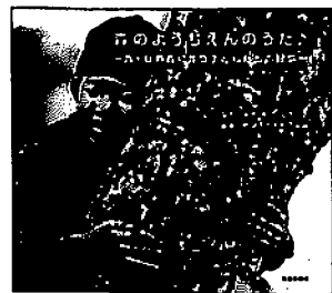
毎日新聞社: 2008年 価格: 1900円・税

世界から貧しさをなくす30の方法 田中愛・畑田秀樹・マエキタミヤコ 監 貧しさは豊かな国の側が作った世界の仕組みの問題だ。現実の「貧しさ」を知ることとともに、「貧困を生み出すしくみに気づく」ことが大事だ。16人の編者を含む執筆者が身近な視点からわかりやすく伝えてくれる一冊。 「おカネで世界を変える30の方法」「戦争をしなくてすむ世界をつくる30の方法」等のシリーズがある。 1人ひとりの生活が、どんなことにつながっているのか、視点を変えれば見えなくなる。 1人ひとりの生活はいいことも、悪いことも、世界へとつながっている。