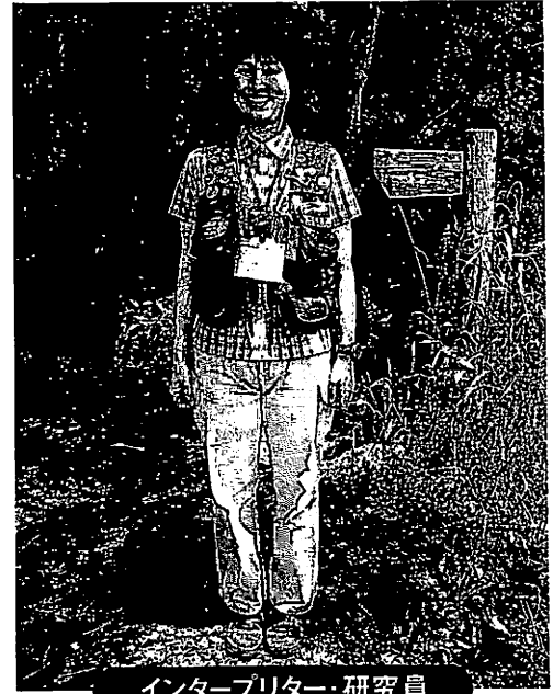
インタープリター・研究員

文と写真＝大石美穂 Text & Photograph by Miko Oishi