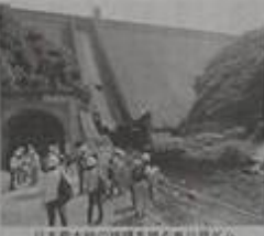
日本最大級の規模を誇る奥只見ダム