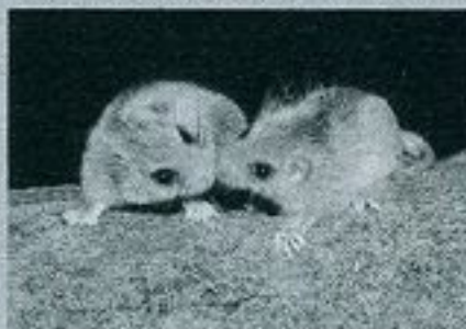
夜行性で目が大きい

夜行性動物のヤマネ。活動期でも昼間は寝ているが、夜は甲子園球場の半分くらいの広さの森の中を縦横無尽に駆け回る。