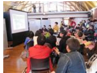
▲10分プレゼンテーション