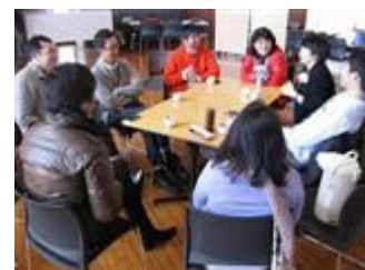
(写真は以前のフォーラムのものです)